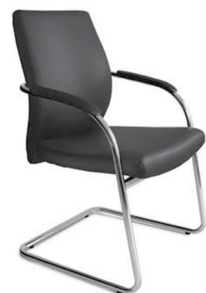
Cadeira base trenó NOW