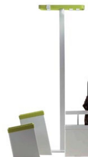
Cabide, Caixote do Lixo e Porta Guarda-chuvas SKY