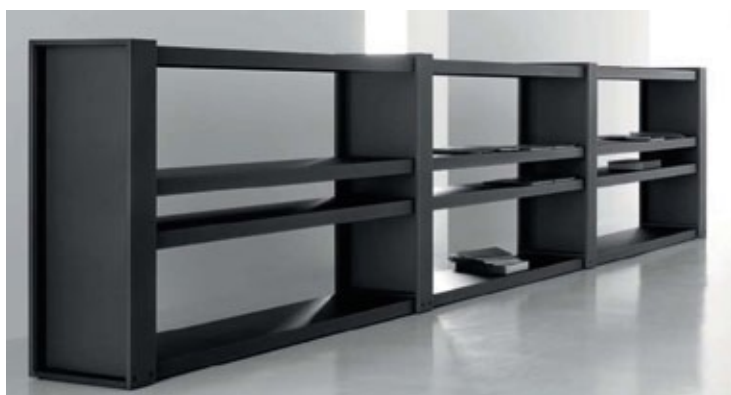
Muro Técnico Mahia