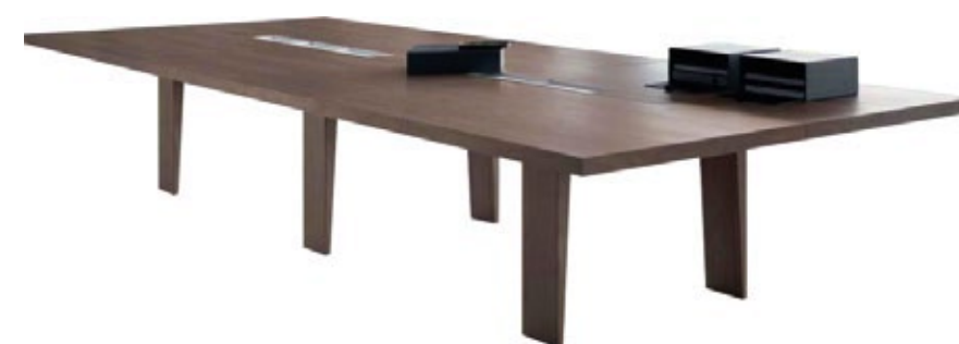
Mesa de Reuniões Mahia