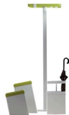
Cabide, Caixote do Lixo e Porta Guarda-chuvas SKY