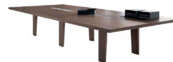
Mesa de Reuniões Mahia