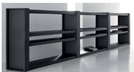
Muro Técnico Mahia