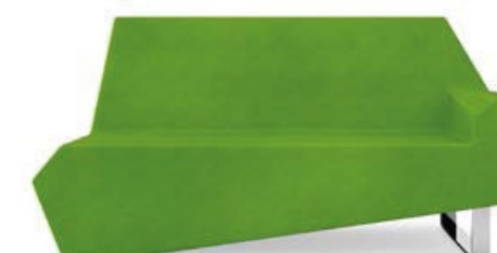
Sofá Duplo LUX