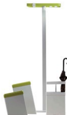
Cabide, Caixote do Lixo e Porta Guarda-chuvas SKY