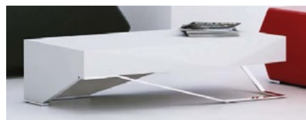
Mesa de Apoio LUX