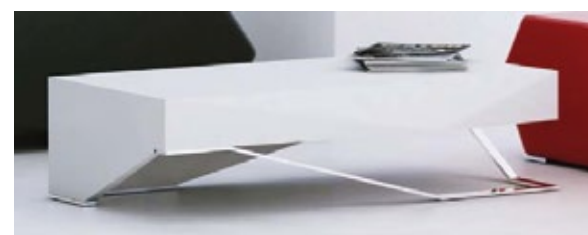
Mesa de Apoio LUX