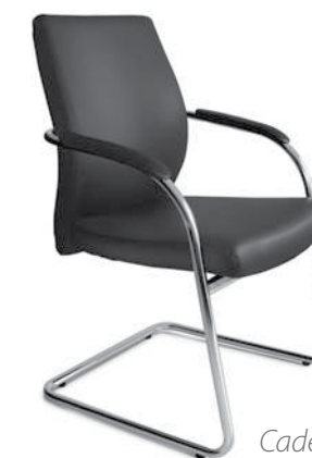
Cadeira base trenó NOW